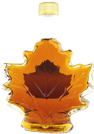
SPBFM0250 250ml 12/cs