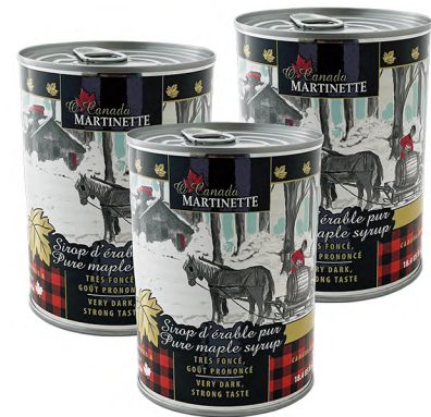
SPCAVD0540 540ml 12/cs