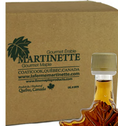
SPBFM0050 50ml 48/cs