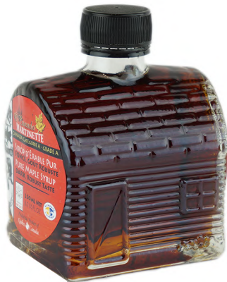
CADCBA0250 250ml 12/cs