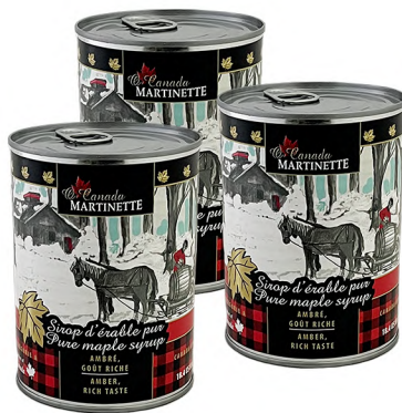
SPCAM0540 540ml 12/cs