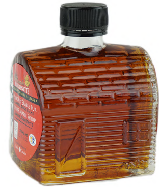
CADCBM0250 250ml 12/cs